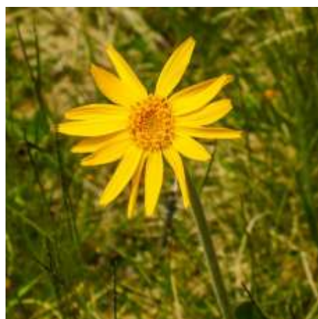
Arnica des montagnes (Arnica montana L., Asteraceae)

En attendant, voici quelques belles images des plantes rencontrées sur nos chemins :