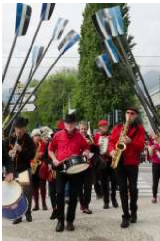
et accueil au siège de l'Aviron Grenoblois sous une haie d'honneur par les jeunes rameuses et rameurs.