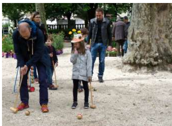
...puis concentration maximum pour gagner !