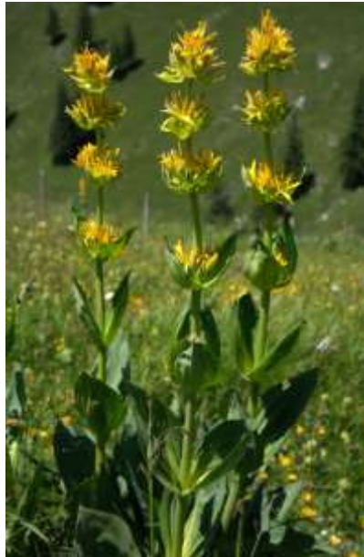
Gentiane jaune ( Gentiana lutea L., Gentianaceae )

Pharmacopée Européenne et Pharmacopée Française (liste A)