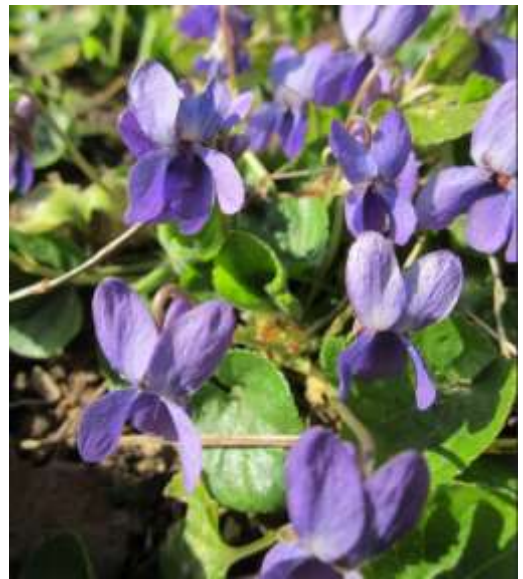
Violette odorante ( Viola odorata L., Violaceae )

Habitat : prés et bois des montagnes de l'Est, du Centre, du Midi ; Corse