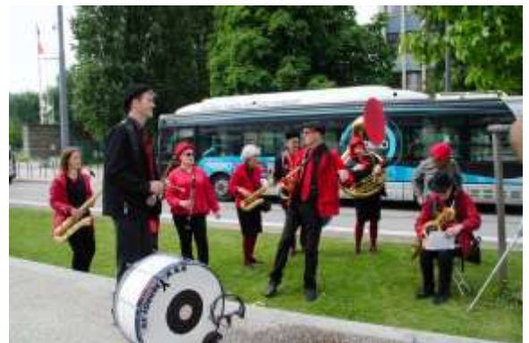
Les fanfares à la station terminus « Presqu'île » avant l'inauguration de la station sous sa nouvelle appellation « OXFORD »...