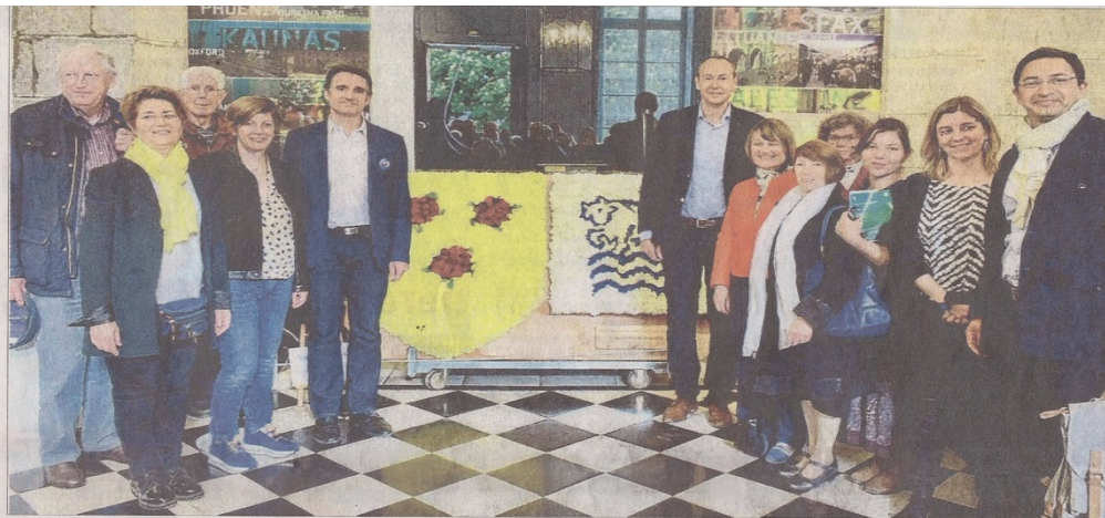
Les membres de l'Alliance Grenoble Oxford et les élus, lors de l'ouverture des festivités du trentième anniversaire.