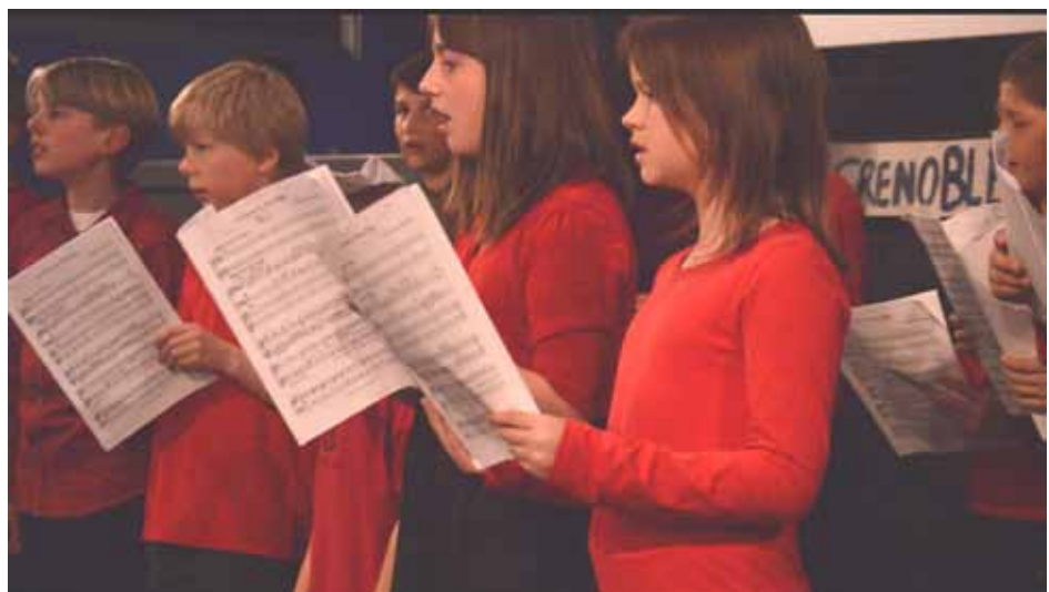
East Oxford Youth Choir at the Ultimate Picture Palace.

The audience was also entertained by a video of two Grenoble school choirs singing the songs as well as by a couple of French animated cartoons. Film-maker Alison Palmer-Smith had led the Grenoble part of the project, making