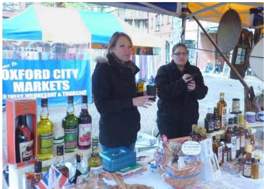
The Ageron sisters on the market stall at Gloucester Green.

Nous reviendrons avec grand plaisir dans cette superbe ville ! Encore merci à tous.