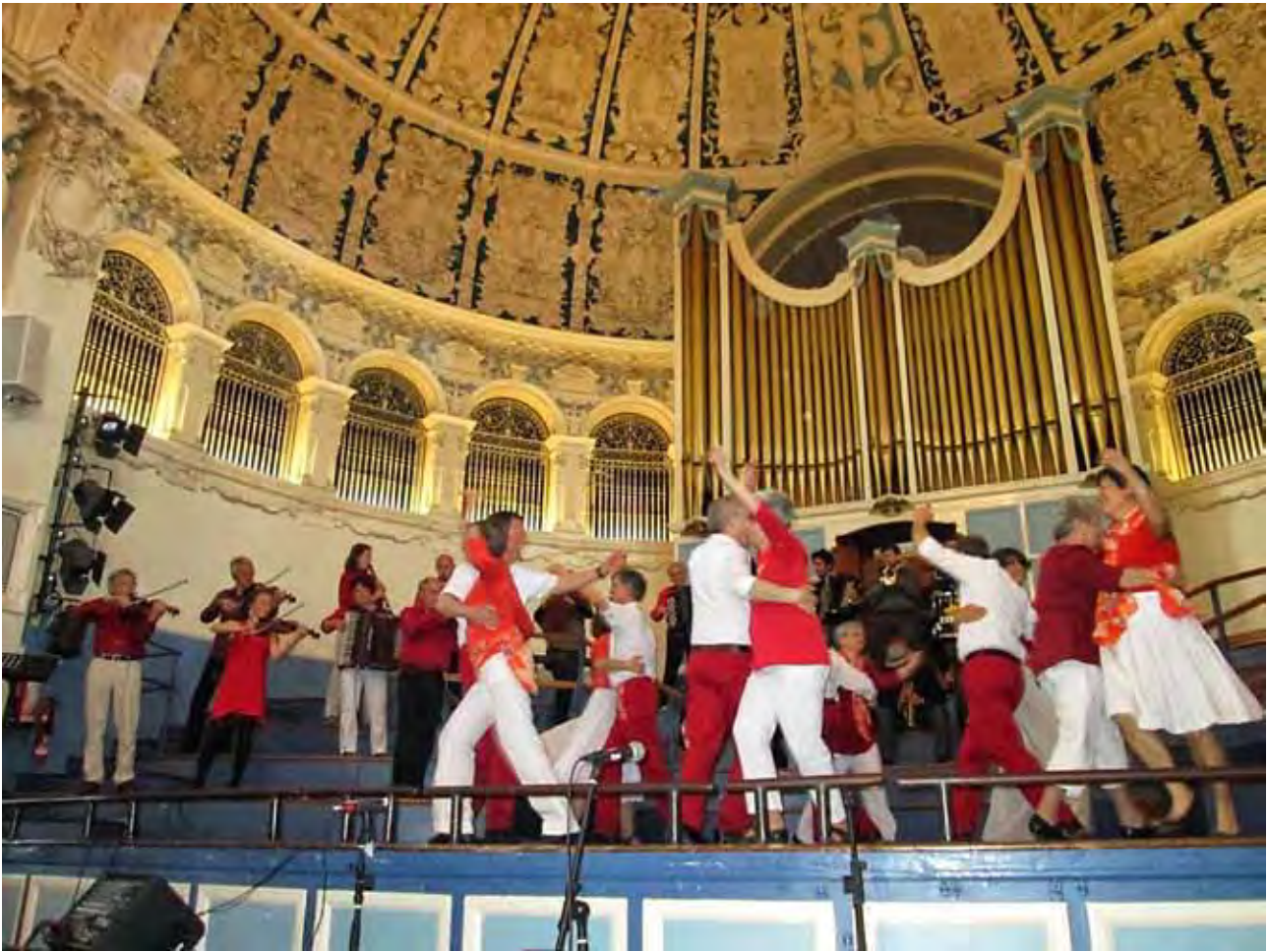
Rigodons et Traditions dancing in the Town Hall at the final day's performance.