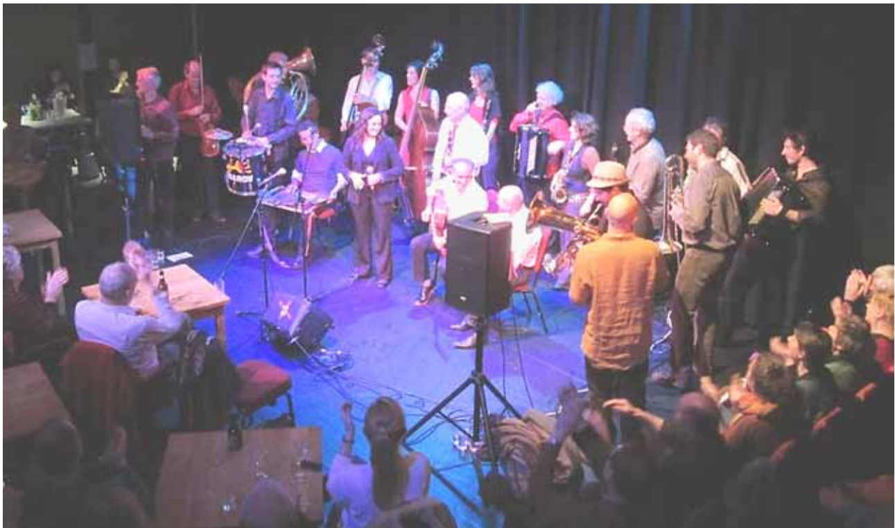
Drôle de Swing, Torivaki and Yebarov and the final number at the Old Fire Station concert.

Le voyage me rendait très anxieuse: imaginez plus de 80 choristes, musiciens et danseurs