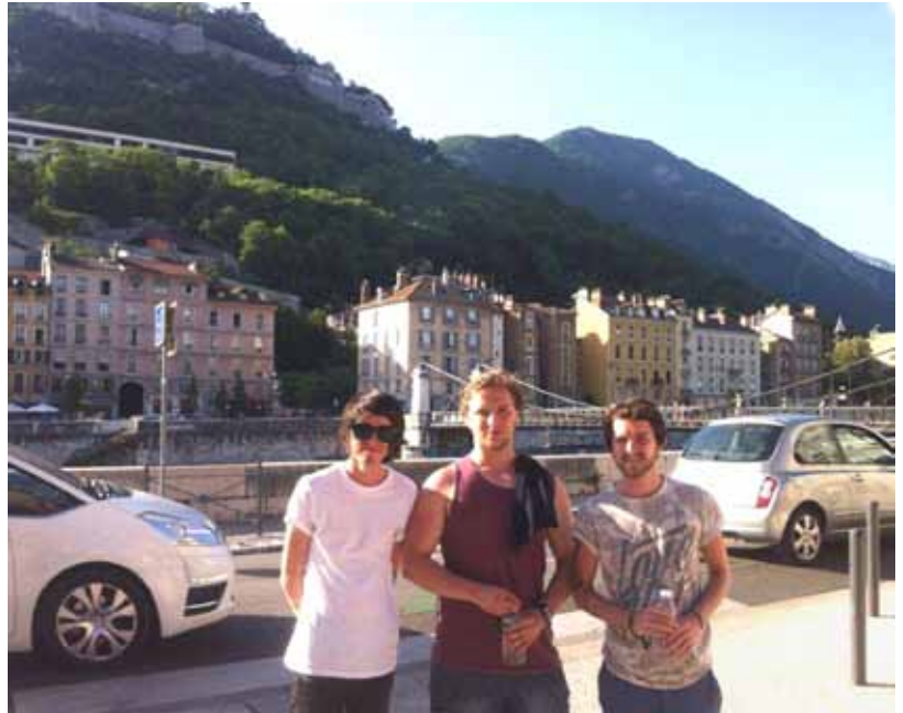
The Method, Oxford-area band in Grenoble.

We spent two weeks out in Grenoble working every day with an Italian band called 'Wild Whiskers', who were great guys and great to work with. We played a few shows in the streets of Grenoble before playing the last show known as the 'Divercities Festival'. We worked on four original songs for that show with 'Wild Whiskers' as we'd play two of our own songs and two of theirs.