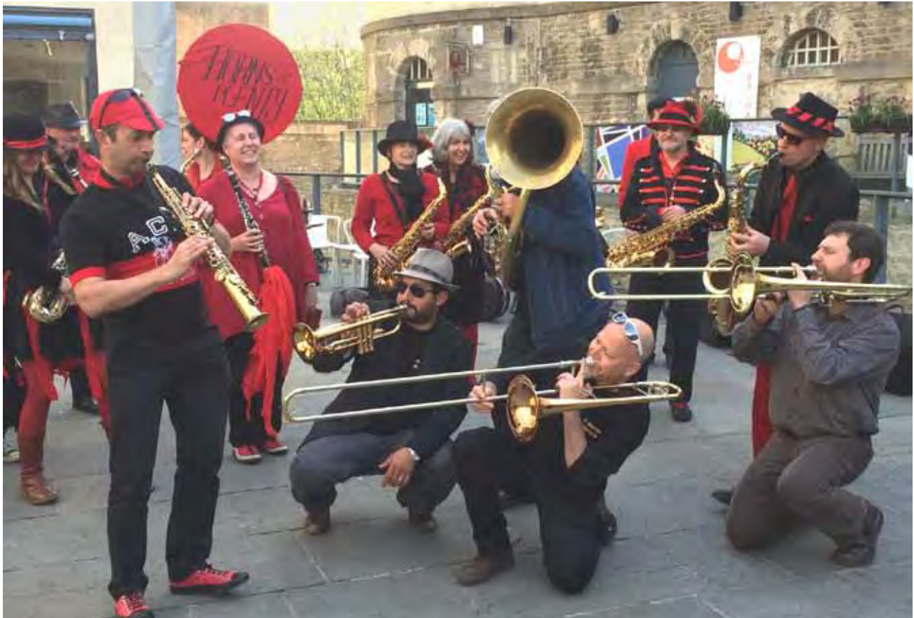
Horns of Plenty of with members of Yebarov at the final evening party.