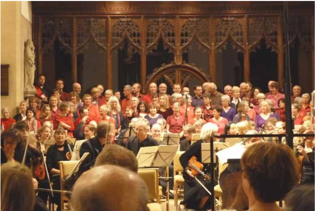
Interlude, East Oxford Community Choir and Orchestra in the church of St John the Evangelist.

Interlude et l'East Oxford Community Choir ont une fois de plus réussi à n'en faire qu'un dans une belle harmonie, vivant symbole d'un jumelage réussi, sous la remarquable direction de James Longstaffe.