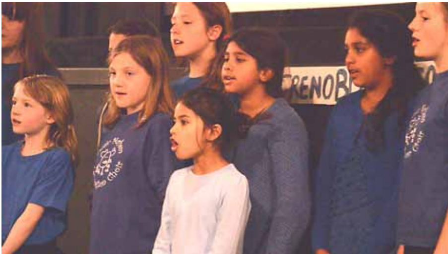
Music Mayhem choirsinging in the Ultimate Picture Palace.

Yebarov and Drôle de Swing were newcomers to Oxford. The sell-out concert the groups gave together at the Old Fire Station had the building rocking.