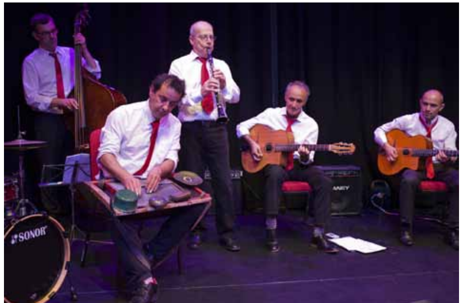
Drôle de Swing.

de la Houille Blanche). Nous avons découvert la planche à laver, célèbre instrument de musique et bel exemple de recyclage écologique après l'invasion des lave-linge.